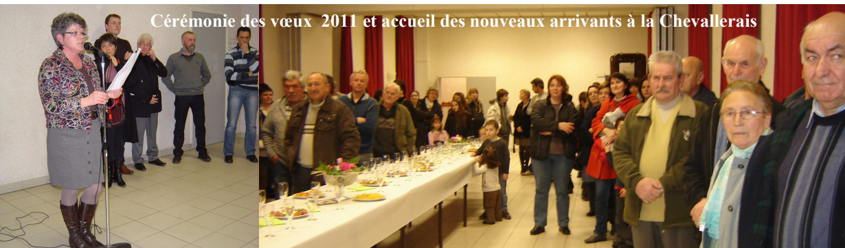
Cérémonie des vœux 2011 et accueil des nouveaux arrivants à la Chevallerais